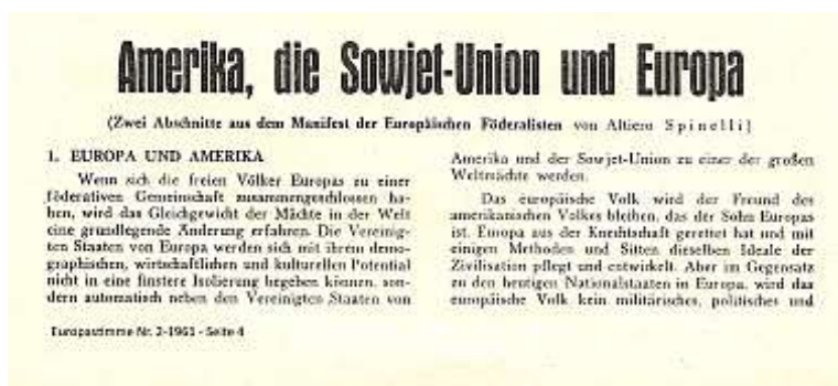
Nummer 5-1961, Seite 3