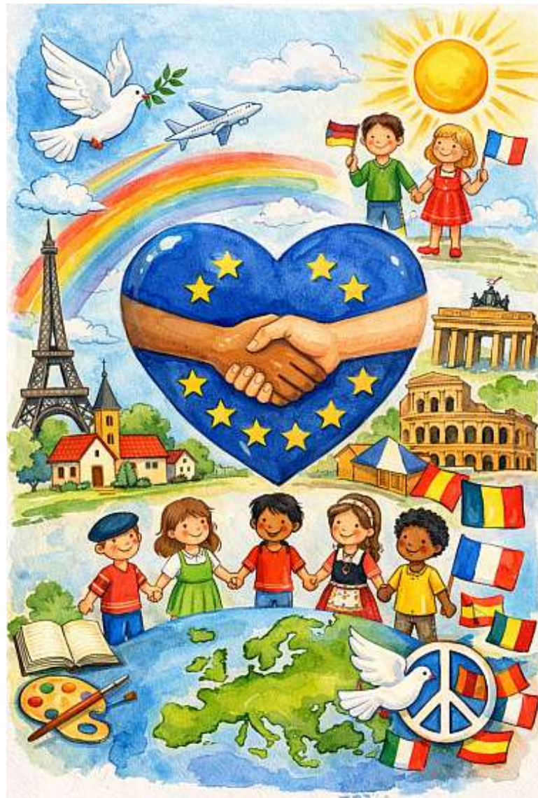
Bildquelle: Mit Künstlicher Intelligenz erstellt – Nationalkolleg „Diaconovici Tietz“ Reschitza