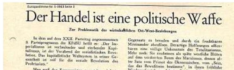
Nummer 1-1963, Seite 3

Die Themen der Europastimme waren und sind immer breit „gestreut“