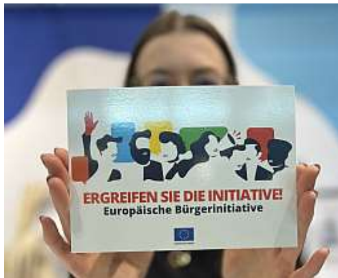
Die Europäische Bürgerinitiative (EBI) ist ein direktdemokratisches Beteiligungsinstrument der Europäischen Union, mit der ID Austria erfolgt eine Unterstützung einer laufenden Initiative rasch und unkompliziert.

Für jedes Land gilt zudem eine bevölkerungsabhängige Mindestzahl an Unterstützungen, in Österreich sind das 14.400 Unterschriften.