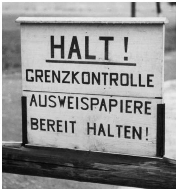
Schild an der deutsch-deutschen Zonengrenze bei Heldra

„Sicherheitsversprechen“ effektiv umzusetzen, werden sie von rechten und rechtsextremen Kräften kritisiert. Das Versagen wird polemisch als Versagen der jeweils aktuellen Regierung dargestellt. Was wiederum viele Menschen glauben und nicht kritisch hinterfragen. Denn gerade im Bereich der illegalen Migration müssen, um effektive Lösungen zu erreichen, alle Unionsmitgliedstaaten an einem Strang ziehen und gemeinsam Probleme lösen wollen. Das eigene Versagen der Politiker in den Unionsmitgliedstaaten „kompensieren“ diese teilweise durch noch mehr Rechtsbrüche im Hinblick auf die Personenverkehrsfreizügigkeit.