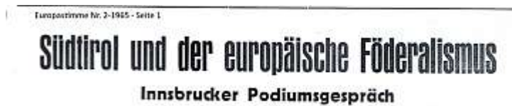
Nummer 2-1965, Seite 1