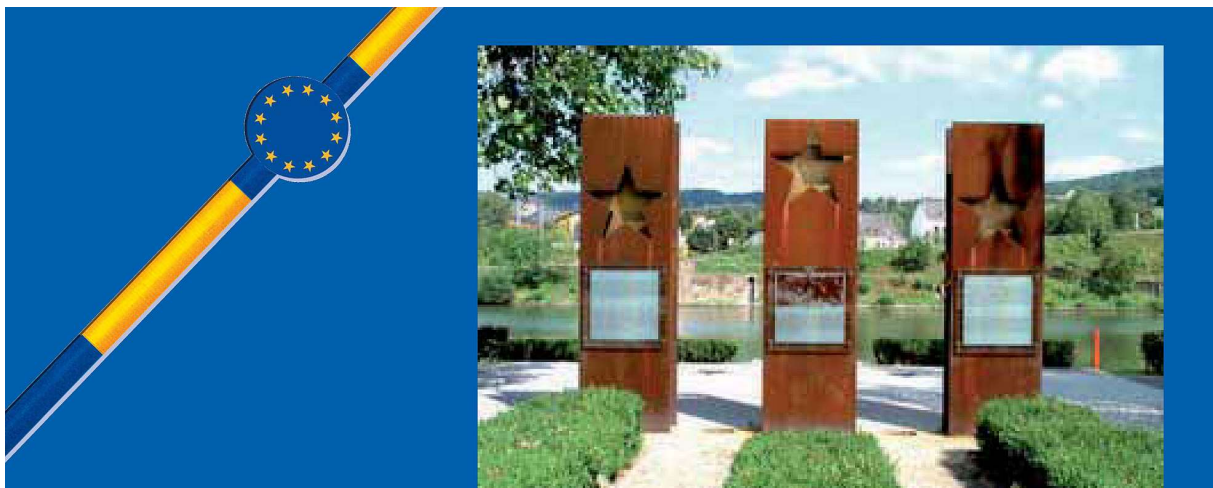
Denkmal zum „Schengener Abkommen“ am Moselufer in Schengen/Luxemburg. Die drei Stahlstelen mit jeweils einem Stern erinnern an die Unterzeichnung des Schengener Abkommens am 14. Juni 1985.

Für die Europäische Kommission ist das Verhalten des EU-Migrationskommissars, Magnus Brunner (ÖVP), der Verständnis für die Maßnahmen der deutschen Regierung zeigt, wohl eher peinlich und vor allem ist es eine Bestätigung und Genehmigung der jahrelang durchgeführten Rechtsbrüche durch deutsche Regierungen. 6