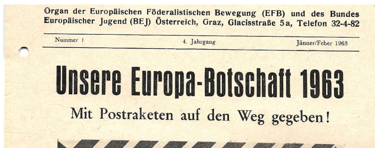
Nummer 1-1963, Titelblatt