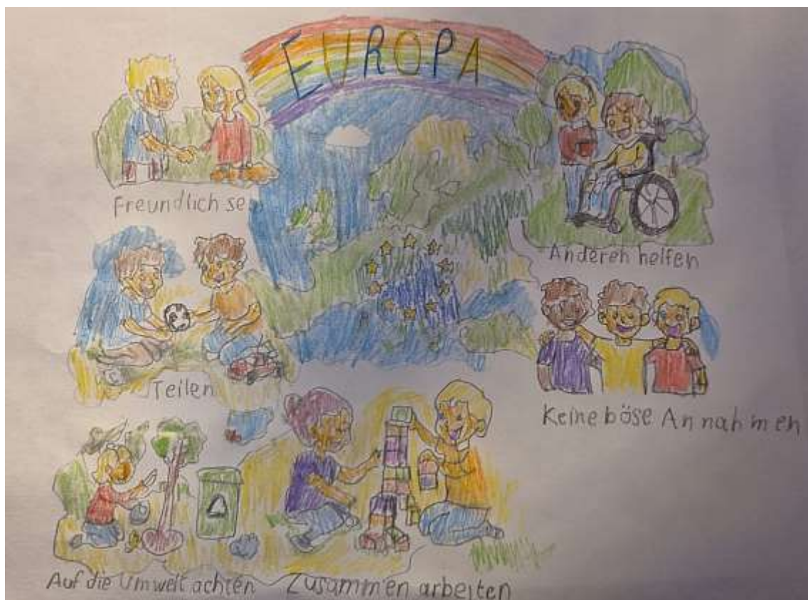
Bildquelle: Lukas Nikolas Racołța – VI. B Klasse