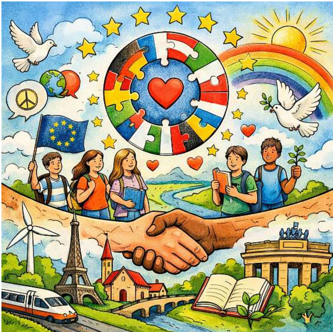
Bildquelle: Mit künstlicher Intelligenz erstellt – Nationalkolleg „Diaconovici Tietz“ Reschitza